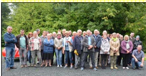
Les Amis du musée dimanche 13 septembre 2015 à Cardonville

Association des Amis du musée des sapeurs-pompiers de France Rue Baron Bigot - 76710 MONTVILLE Tél./fax : 02 35 33 13 51 Courriel : musee-sapeurs-pompiers@wanadoo.fr