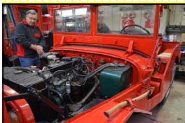
VLR Delahaye de Rouen en restauration à l'atelier de Cardonville