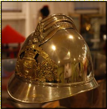
Casque officier 1908

Très rare jeton d'identité en bronze d'un sapeur-pompier de Rouen. Période révolutionnaire. Marquage à l'avvers : Municipalité de Rouen - Pompiers Liberté - Egalité au revers.