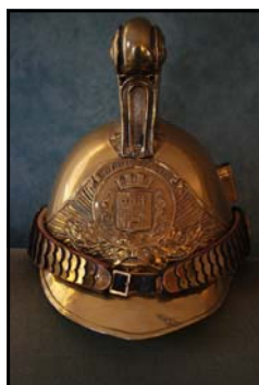
Casque Rouen 1855