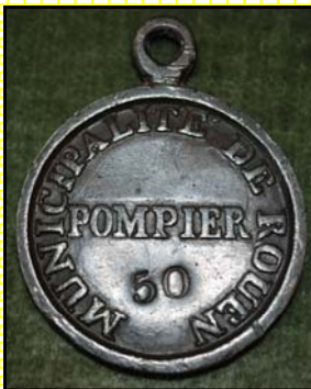
Jeton d'identité Rouen

Maquette au 1/18ème de l'échelle de 45 mètres Berliet-Magirus de Lille. Cet objet de collection devait être proposé à la vente en éléments séparés à monter soi-même. La commercialisation n'a pas été réalisée. C'est ce qui en fait une pièce unique et remarquable.