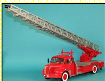
Maquette échelle 45 m