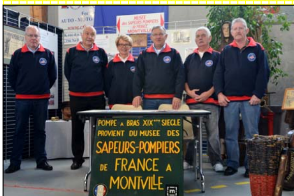
Forum des associations - Montville 13 septembre 2015